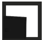
RAL 9005 negro