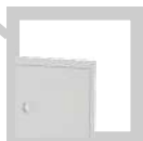
RAL 7035 gris claro