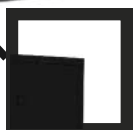
RAL 9005 negro