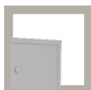
RAL 7035 gris claro