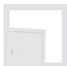
RAL 9003 blanco